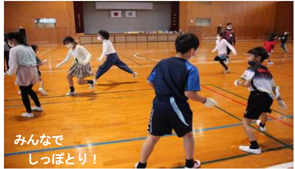
みんなでしっぽとり!

1月14日(土)に第7回「ふるさとまなび~隊(レクリエーション大会)」を実施し、児童13名が参加しました。ジェスチャー伝言ゲームやボールゲーム、オセロ、しっぽとり、ドッチビーなど様々なレクリエーションを指導員と一緒に楽しみました。