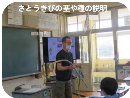
さとうきびの茎や種の説明

安納小学校：サトウキビについて知ろう「サトウキビの出前授業」〈11月16日 児童・職員計21名参加〉