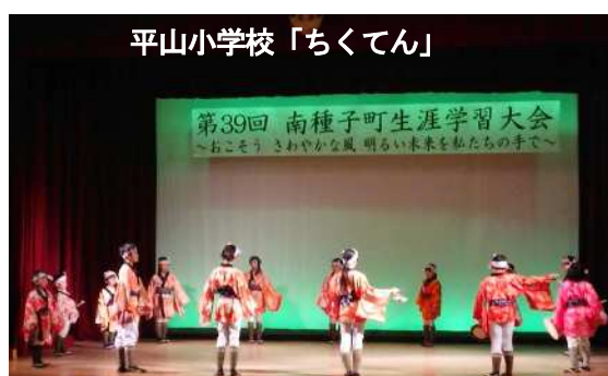
平山小学校「ちくてん」