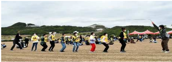
▲子ども会対抗長縄跳び競争