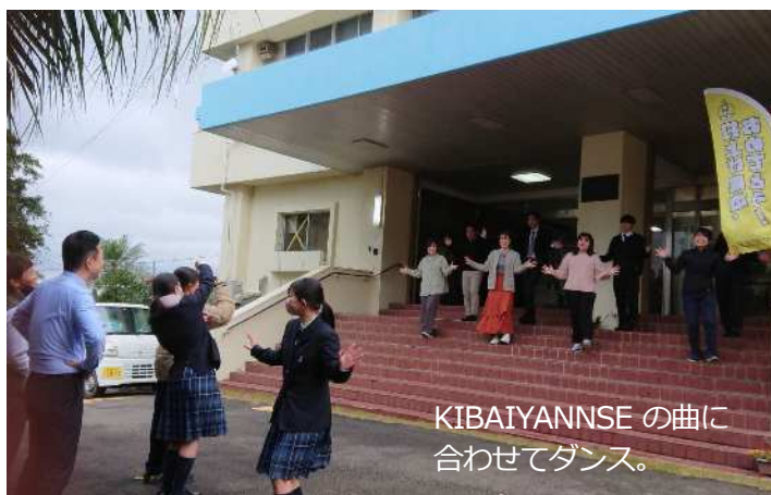
KIBAIYANNSEの曲に合わせてダンス。