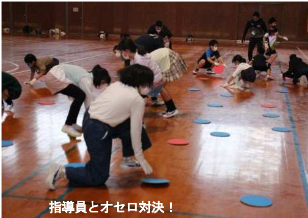
指導員とオセロ対決!

レクリエーションをするなかで他校の友達もでき、仲良く活動している児童たちの様子も見られ、大変充実した活動となりました。3月には今年度最後の活動「ナイトミュージアム」が予定されています。