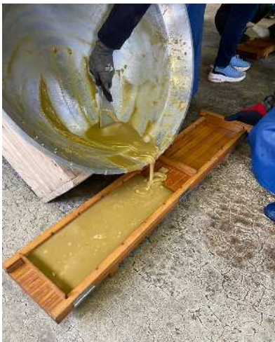
▲黒糖を型に流し入れる作業

今回の体験を通して、食べ物を作る大変さや食への関心を高めることができましたと思います。