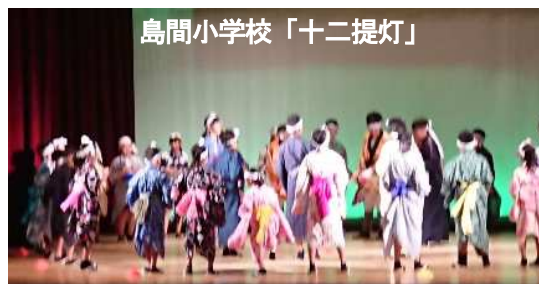
島間小学校「十二提灯」

当日見学に行ったのでご紹介 島間小「十二提灯」、平山小「ちくてん」郷土芸能の発表がありました。歌やお囃子を覚えるのは大変だと思いますが、地域の方から指導を受け、堂々たる踊りを披露した。宇宙留学生にとっても貴重な体験だったと思う。指導者・関係者も会場に足を運んでいて（地域で育てている）頼もしい景色だった。