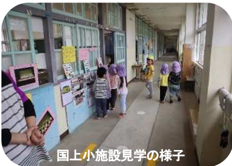
国上小施設見学の様子

国上小学校：くにがみこども園との交流・感謝祭の贈り物と授業参観・国上っ子まつり 〈11月22日・12月14日 くにがみこども園園児・職員 国上小児童（1・2年生）職員参加〉