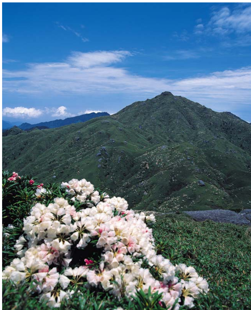
屋久島国立公園誕生（平成24年3月16日） 「シャクナゲと宮之浦岳」