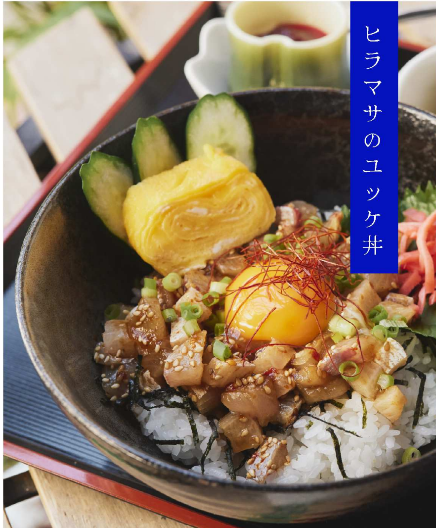
ヒラマサのユッケ丼