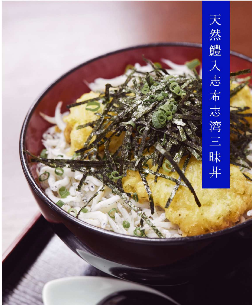
天然鱧入志布志湾三味井