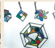
制作完成品(イメージ)