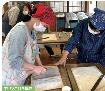
中谷ソバ打ち体験