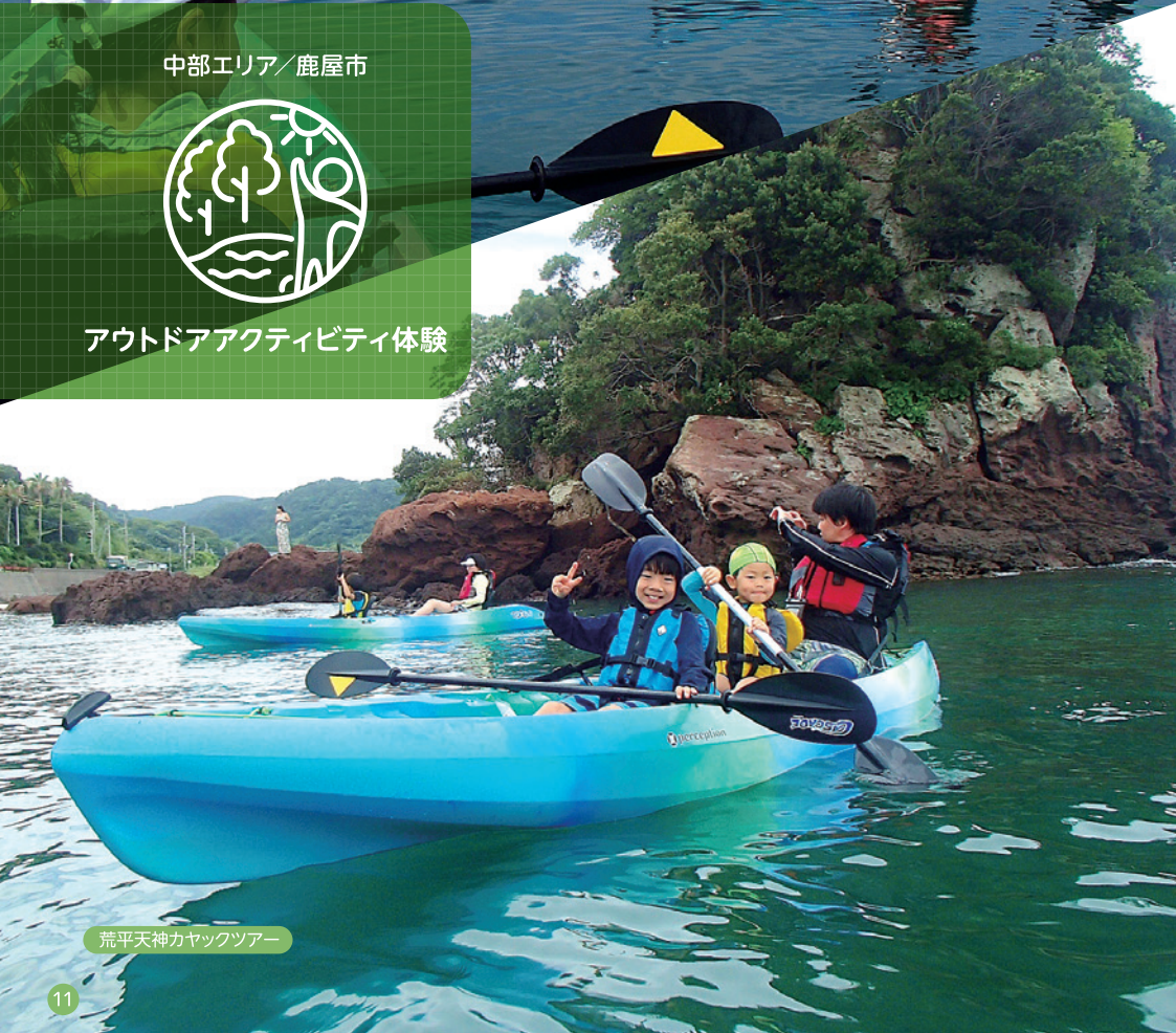
荒平天神カヤックツアー