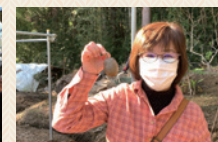
とっても甘いゴールデンキウイ