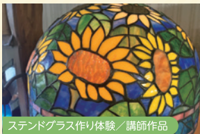
ステンドグラス作り体験 / 講師作品