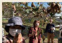
キウイフルーツ収穫体験