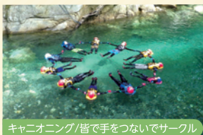
キャニオニング/皆で手をつないでサークル

山と海が調和し、特に志布志湾沿岸の美しい景観が魅力的です。農業と漁業が盛んで、伝統文化と地元の見事な美食が融合している街です。