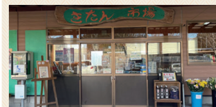
山の駅 きたん市場