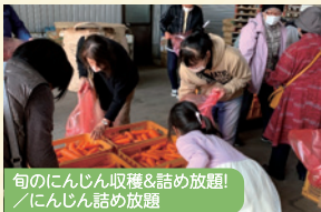
旬のにんじん収穫&詰め放題! / にんじん詰め放題

白鹿岳や高之峰の雄大な自然景観に恵まれた街。大河原峡や花房峡などの清流と森林が豊富なスポットでは、自然を満喫しながらキャンプやアウトドアを楽しむことができます。