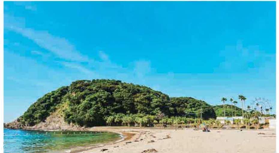
9 ダグリ岬海水浴場 だぐりみさきかいすいよくじょう

標高550mの高台にあり、眼下に桜島、東に志布志湾、北に霧島連山、南に高隈山と360度の大パノラマを眺められる景勝地。