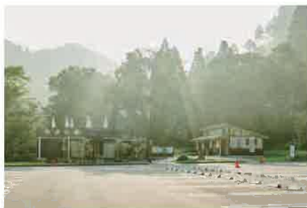
広々とした駐車場。トイレもカフェもある。