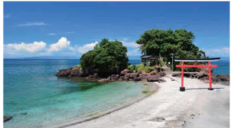
⑥ 荒平天神 あらひらてんじん

薄いベージュ色の少し粒子の細かい本当に美しい砂浜、海の青、渾にやさしくたどり着く白波はまるで絵画のように美しい。