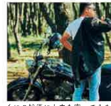
くにの松原にも立ち寄ってみた

最南端へたどり着いた達成感とともに、これまでの道のを振り返る。いつの間にか時間が経っているような、どれもこれも気持ちいい感動をもらえた。まだ見ぬ雄川の滝は、また今度。バイクの長旅でお尻が少し痛い。帰りは根占港からフェリーで薩摩半島へ、少しだけラクをしたくなった。