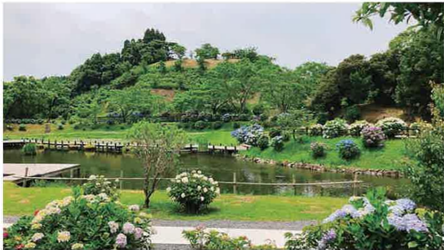
8 普現堂湧水源 ふげんどうゆうすいげん

白砂の海岸が続き突き出したダグリ岬に位置する、亜熱帯の植物が生い茂る海水浴場。志布志湾が一望できる美しい景観も見どころ。