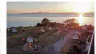
ユクサおおすみ海の学校