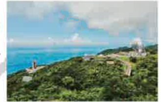
内之浦宇宙空間観測所