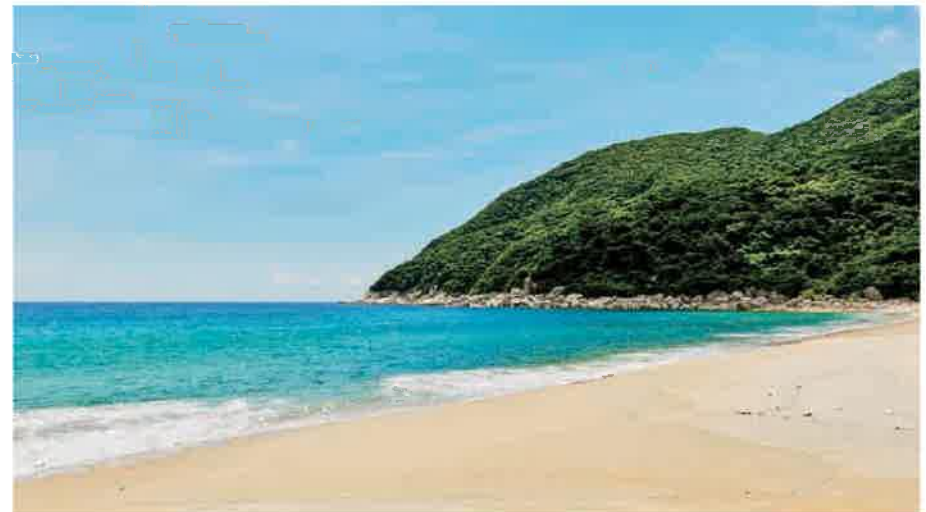
⑤ 辺塚海岸 へつかかいがん

天然の石畳の隙間に水が流れている。もちろん、川の水も透明で、近くにはオートキャンプ場も、バンガロー村もあり、アウトドア好きにはたまらない自然が広がっている。