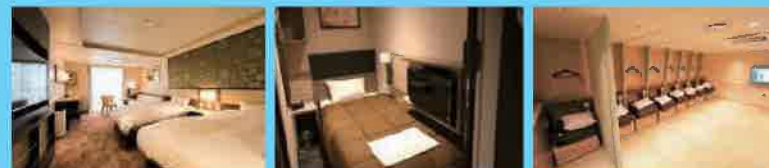
客室は、豪華なスイートルームから、ツーリストルームまで全11タイプの部屋があり、旅のカタチに合わせてくれます。また、大浴場も備えていて洋上の景色を楽しみながら、ゆっくりお風呂に入る贅沢なひとときも過ごせます。