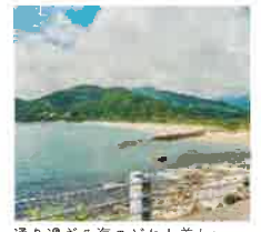
通り過ぎる海のどれも美しい