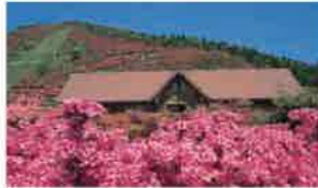
高峠つつじヶ丘公園

(ルールを守って見学可) 園主が作り上げた景観。11月下旬から12月上旬は黄色に染まり壮観。垂水を一望できる。