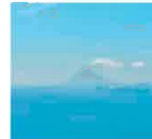
開聞岳が浮かぶように見える