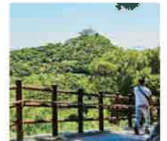
佐多岬 整備された遊歩道