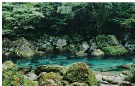
美しい川を横目に歩くので思った以上に疲れを感じない。