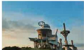
輝北うわば公園 (絶景7)