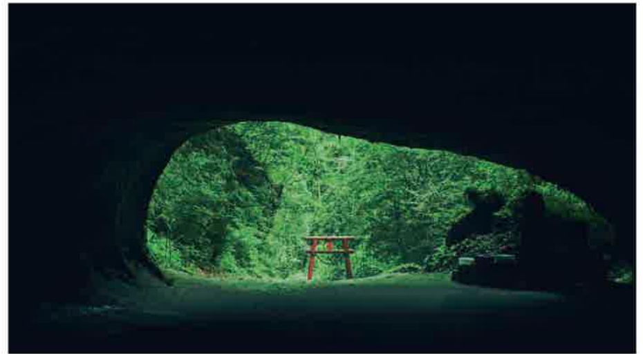
10 溝ノ口洞穴 みぞのくちどうけつ

平成の名水百選。3つの池からなる地元の人に欠かせない水源。5月～6月は1000本ものあじさいが咲いて、圧巻。