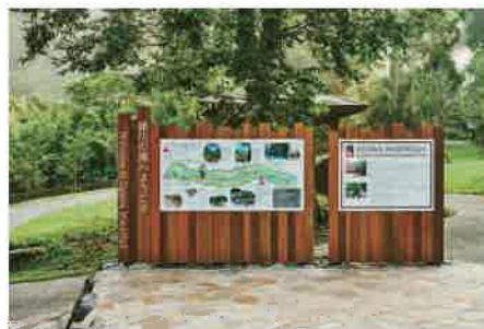
滝入口にある案内板。英語表記もされていた。