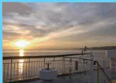
品揃えが充実した販売コーナーやどれも美味しく選べるバイキングを楽しめるレストラン、海を見ながらゆったりと腰掛けて談話できるスペースなどの施設も新しく綺麗。またデッキより洋上から朝日がのぼる様子を楽しめたりと、船旅ならではの贅沢気分を味わっているうちに志布志港に着く。そんなイメージです。

「さんふらわあ」なら旅の自由度がグンと上がります。 愛車で乗り込んで、まるでホテルのような船内でゆっくり過ごす。 快適に寝れて朝の準備が終わった頃には、もう志布志に到着。 あとは、大隅の旅を満喫するだけ。 ペットと旅したい人向けにペットホテル、ドッグランも完備。 あなたらしい大隅の旅を楽しんでください。