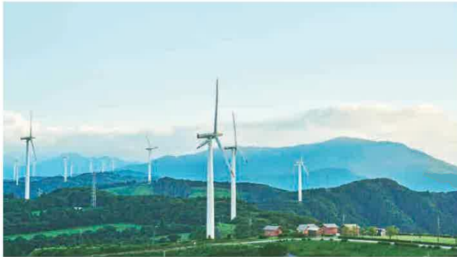
7 輝北うわば公園 きほくうわばこうえん

標高550mの高台にあり、眼下に桜島、東に志布志湾、北に霧島連山、南に高隈山と360度の大パノラマを眺められる景勝地。