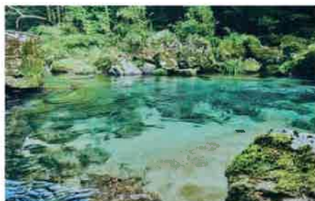
遊歩道を歩いていると脇には透明感のある川が流れている。水が冷たく気持ちいい。