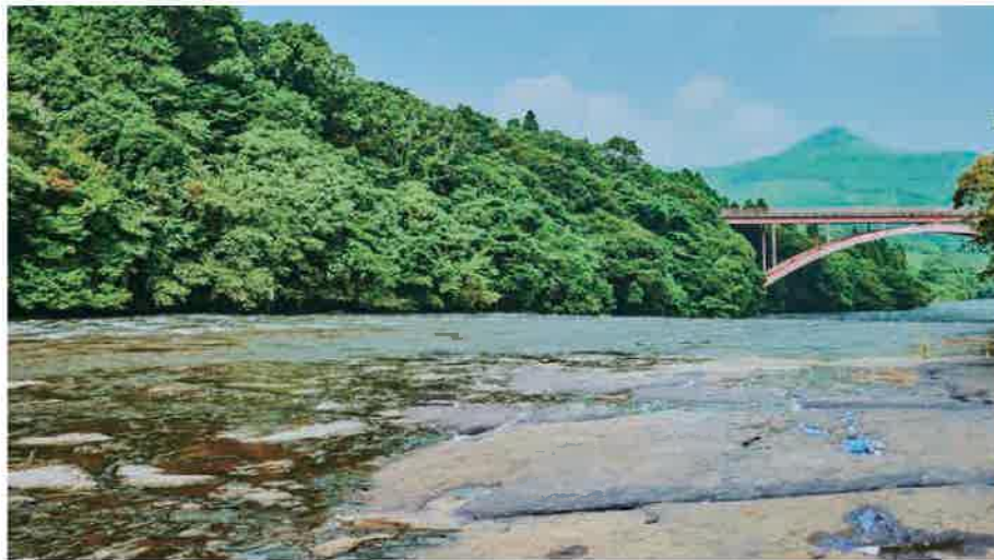
④ 花瀬川 はなせがわ

この場所の名前がダテでないことは、すぐに気づく。高台とはいえ、ここに立つと地球規模のパノラマをきっと感じることができる。