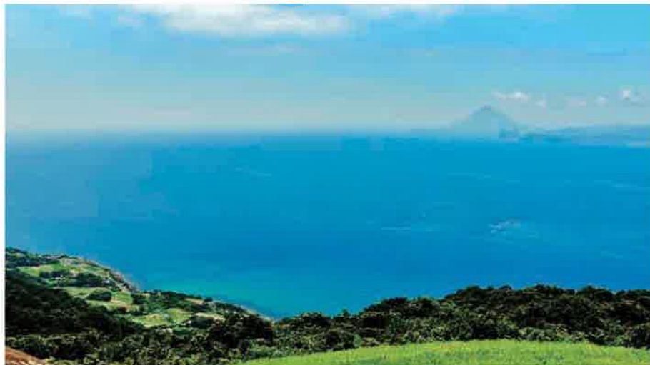
③ パノラマパーク 西原台 にしはらだい

この場所の名前がダテでないことは、すぐに気づく。高台とはいえ、ここに立つと地球規模のパノラマをきっと感じることができる。