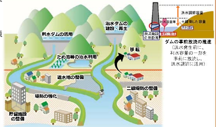
関係省庁が連携した流域治水対策

(河川・ダム) 達成目標: 約73%(1級河川)、約71%(2級河川) (農業水利施設) 達成目標: 100%(約21万ha) (国有地) 達成目標: 100%(令和7年度までのできるだけ早い時期を目指す)