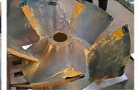
排水機場(羽根車の劣化)