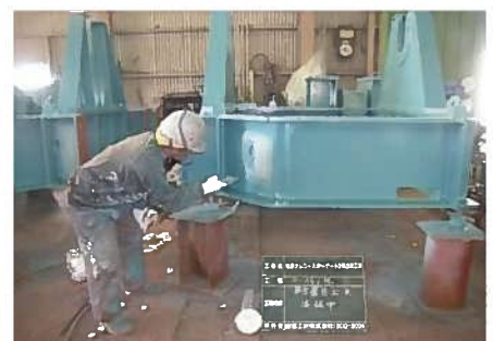
塗装による機械設備の補修