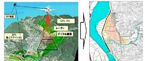
小規模河川におけるLPデータを活用した簡易的な水害リスク情報の整備