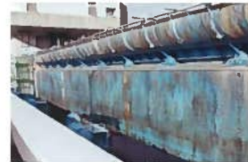
水門(ゲート塗装の劣化)