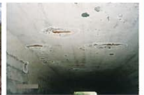
樋門・樋管(鉄筋の露出・腐食)