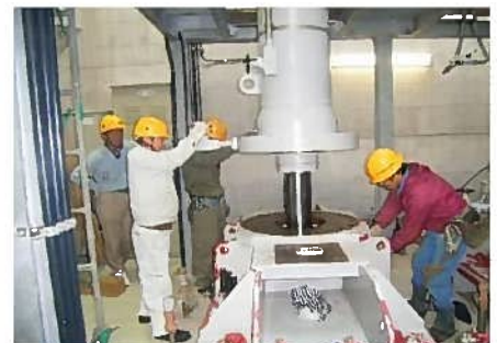
分解・部品交換による機械設備の修繕・更新