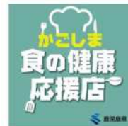
令和4年度は令和5年1月31日現在