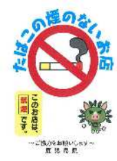
登録店舗数（令和5年1月31日現在）

肺がんや循環器疾患などの生活習慣病予防対策として、受動喫煙対策に取り組む飲食店又は喫茶店を「たばこの煙のないお店」として登録し、ホームページなどを通じて情報提供を行い受動喫煙防止を推進しています。