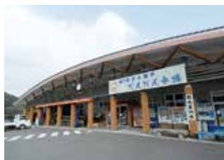
道の駅 黒之瀬戸だんだん市場 (外観)

☎0996-86-1111 (長島町水産商工課) 🚗 散策自由 🚗 約6台 (道の駅 黒之瀬戸だんだん市場に併設) 📍 阿久根北ICより約15分 (長島町山門野)