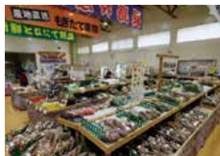
黒之瀬戸だんだん市場 (売場)

☎0996-65-2222 (道の駅 黒之瀬戸だんだん市場) 🕒 9:00~18:00 🚗 40台 困 1/1~1/3 📍 阿久根北ICより車で約15分 (長島町山門野)