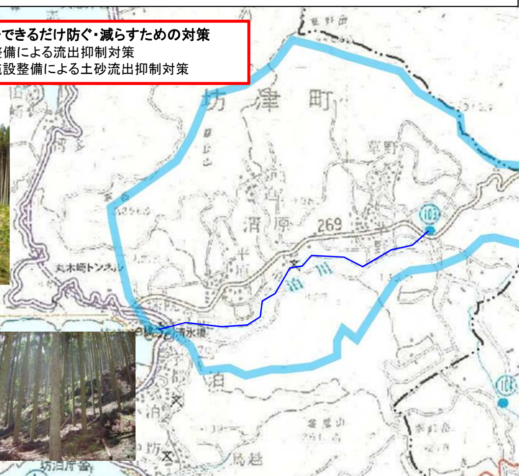
治山施設の整備（溪間工・山腹工）