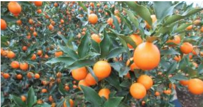
写真1 たわわに実ったハウスきんかん

今年度のJA南さつま産ハウスきんかんの集荷は、12月2日よりJA選果場で始まりまし。今年産はやや小玉傾向ではあるものの、着色・品質は良好であり、県内をはじめ関東・関西方面で、230tの共販量を3月中旬