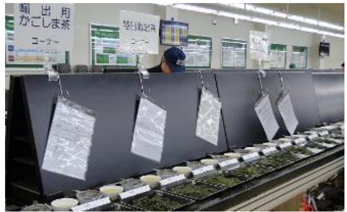
令和2年 2020年全国お茶まつり鹿児島大会in南九州市を成功させよう！

農政普及課では、今後も、関係機関・団体一体となって、輸出茶生産と安心・安全な茶づくりを推進していきます。