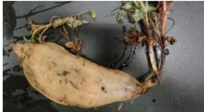
写真2 育苗床での発病の様子