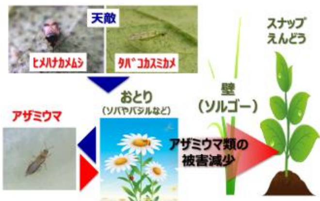
図1 スナップえんどうのアザミウマ対策