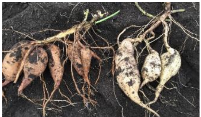
写真3 収穫時の芋の様子 左「こないしん」、右「シロユタカ」

芋のつるが太いため、芋の立枯・腐敗を引き起こすつる割病に強いという特徴があります。反面、手作業で芋を切り離しにくいことが難点です。