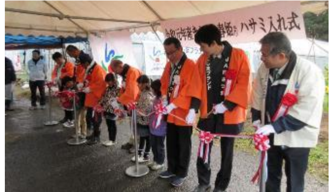
写真2 きんかん春姫®ハサミ入れ式

そのうち、1月中旬から始まる「きんかん春姫®」（平成27年3月13日にJA南さつま商標登録）は180tの計画であり、JA南さつまは、ハサミ入れ式やラジオ放送などで消費者へのPR活動も積極的に展開しています。本年度は令和2年1月14日に、「きんかん春姫®ハサミ入れ式」を地元の園児5人を招待して、盛大に開催しました。鹿児島の冬のおいしい果物の1つとして、ご賞味ください。