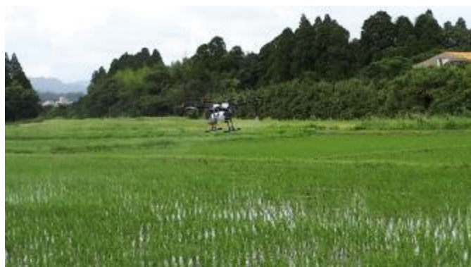
写真2 ドローンで適期防除が可能に