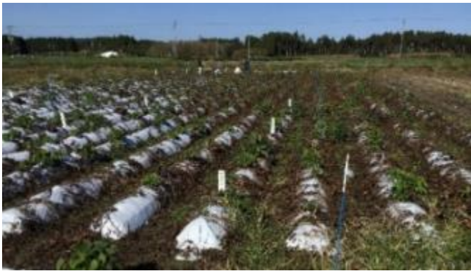
写真1 基腐病が多発したほ場

5月下旬から茎が黒変する症状が各所で見られ始め、8月上旬から被害が拡大、9月以降には一面に被害が発生したほ場も確認されました。