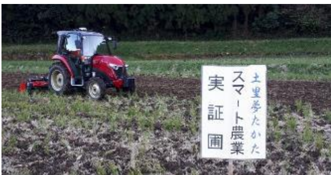
写真1 自動操舵運転で耕起作業

○次年度も引き続き、中山間地へのスマート農業普及・推進のモデルとなることを目指して実証に取り組めます。