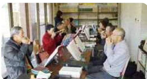
内山田ハーモニカ同好会

「上之口老人クラブ」は、地域住民の一員として、生涯にわたる自己管理能力と相互連帯意識を高め、心身ともに健康で明るく生きがいのある生活を送ることを目的に、定期的に学習活動や社会奉仕活動を行っています。