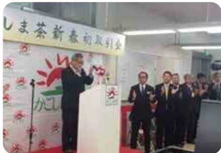
新春初取引会で南九州市茶業振興会が銘柄統一をPR

今回の銘柄統一により、知覧茶の販売量拡大だけでなく、消費者の認知度が高まることで、産地の活性化が期待されます。