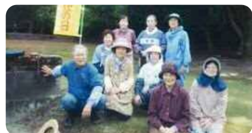
上之口老人クラブ