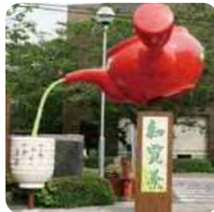
「知覧茶」をPRする巨大な急須モニュメント (知覧特攻平和会館駐車場)