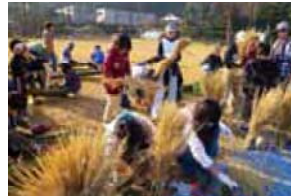
長屋まっくろ塾(門松づくり)