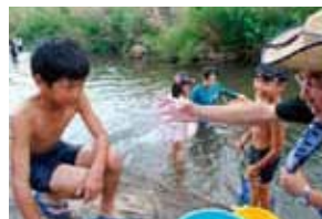
いきいき「大丸学舎」 (水質調査)