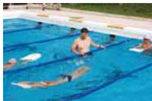
颯娃小学校応援団(南九州市颯娃町) (泳法指導の支援)

学校支援ボランティア活動を始めたいと思われたら、お住まいの市の教育委員会の社会教育課または生涯学習課にお問い合わせください。