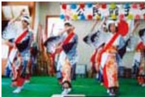
塩屋四つ竹踊り (枕崎市塩屋公民館)

南薩地域では、それぞれの地域で多様な郷土芸能や伝統行事などの伝統文化が受け継がれています。少子高齢化・過疎化による担い手不足などにより、伝統文化の保存・継承が難しくなっていますが、学校の行事や総合的な学習の時間、地域の公民館活動などにより、身近な伝統文化の継承が図られています。