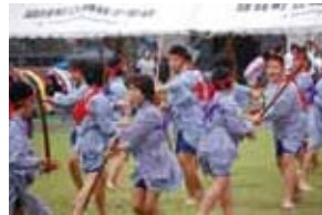
棒踊り (南九州市立穎娃小学校)