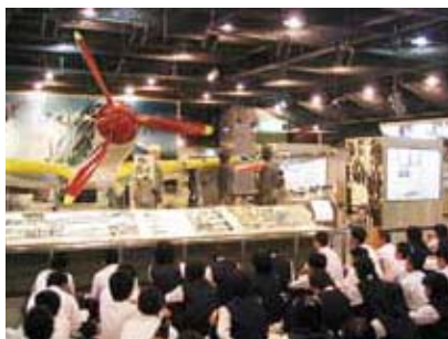
知覧特攻平和会館(南九州市知覧町)

各資料館では、特攻隊員たちの遺書・手紙などの閲覧や語り部の説明を通じ、平和の大切さ・ありがたさ、命の尊さを学習することができます。また、平和スピーチコンテストや各種資料の企画展示が行われるなど、平和や命の大切さを学ぶ取組が様々な場所や機会で行われています。