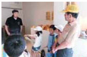
丹波いきいき学校応援団(指宿市) (町たんけん(探検)の引率)

南薩地域においても、管内のすべての市に地域本部が設置され、登録されたボランティアの方々が学校支援活動に取り組まれており、学校を地域全体で盛り上げようとする気運が高まりつつあります。