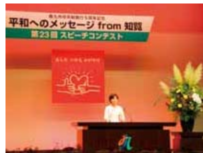
平和へのメッセージfrom知覧 スピーチコンテスト(南九州市知覧町)