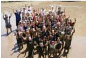
たかた三世代塾(田遊び)