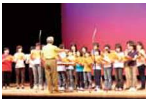
益山わくわく塾(合唱)