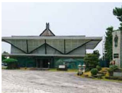
万世特攻平和祈念館(南さつま市加世田)