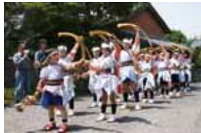
中津野お田植え踊り (南さつま市立阿多小学校・金峰中学校)