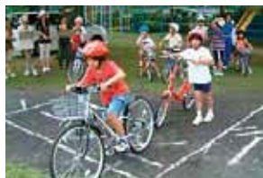
田代かじかクラブ (交通安全教室)