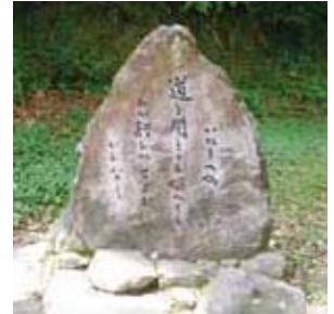
竹田神社(南さつま市加世田) 内にあるいろは歌の歌碑

(昔の賢者の立派な教えや学問も口に唱えるだけでは、役に立たない。実践、実行することがもっとも大事である。)