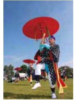
琉球傘踊り (指宿市立利永小学校)