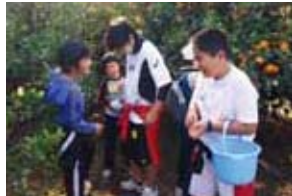
津貫未来塾(みかん狩り)