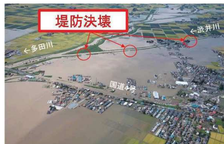
平成27年9月関東・東北豪雨における災害復旧工事（宮城県大崎市）