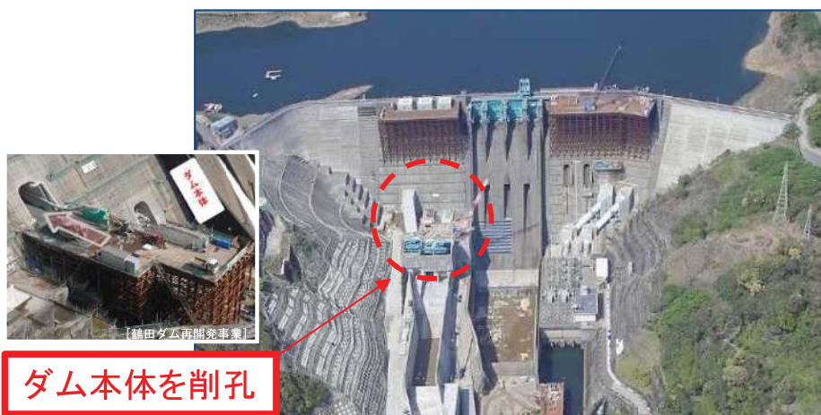
鶴田ダム再開発事業（鹿児島県薩摩郡さつま町）