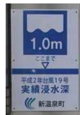
＜電柱に表示 兵庫県新温泉町＞