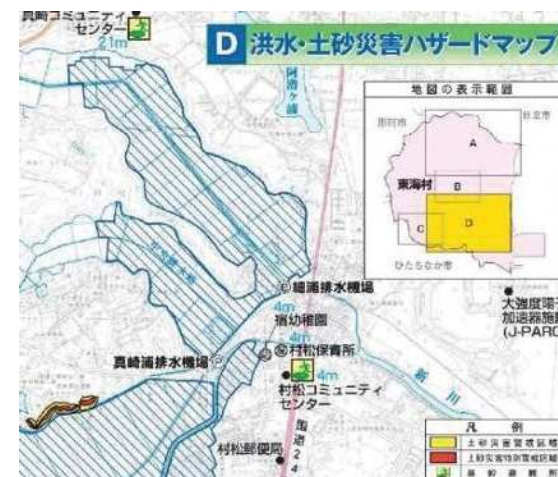
＜過去の浸水実績図 茨城県東海村＞

「避難すべき住民等が居住する住宅や高齢者等の防災上の配慮を要する者が利用する施設が近傍にある河川」等を想定