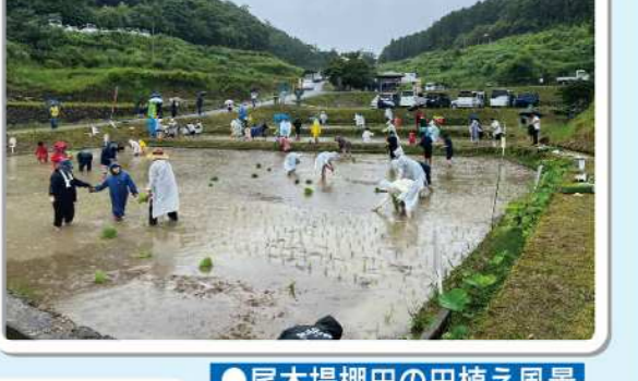
●尾木場稲田の田植え風景