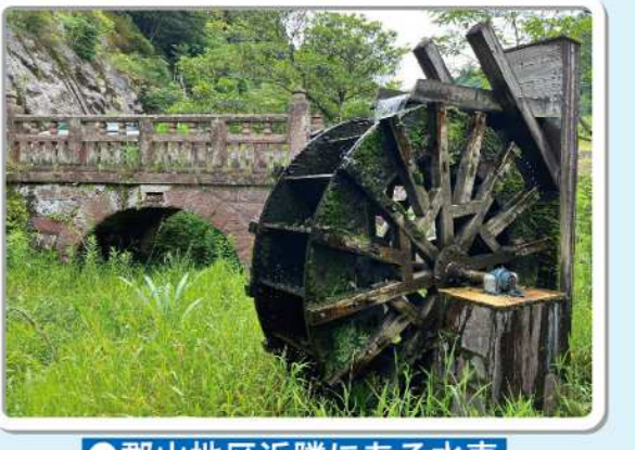
●郡山地区近隣にある水車