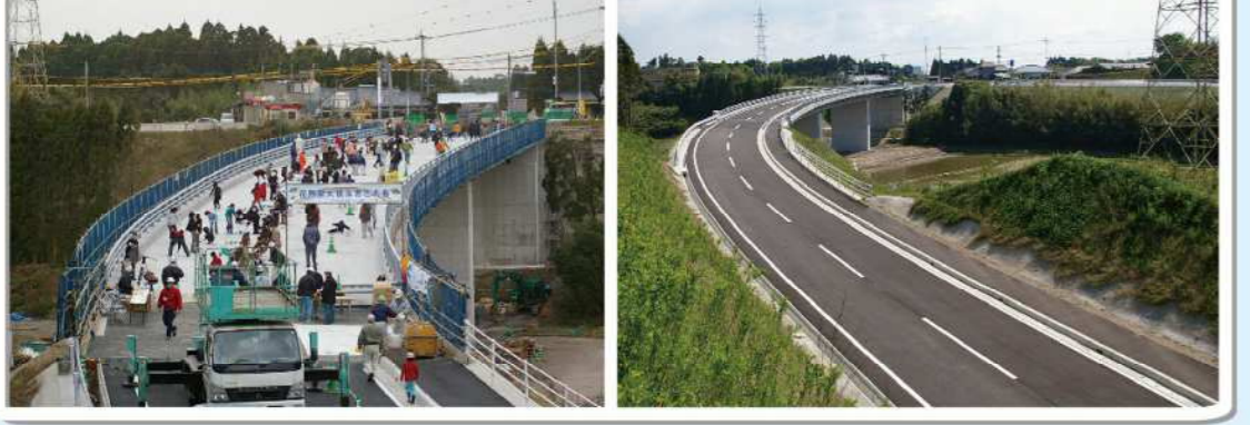
●広域農道 日置南部地区