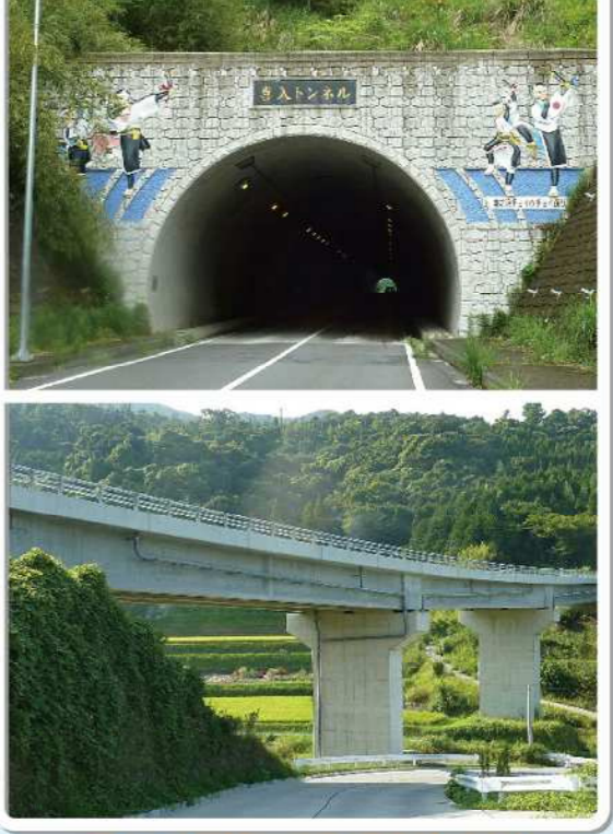
●広域農道 南薩東部地区