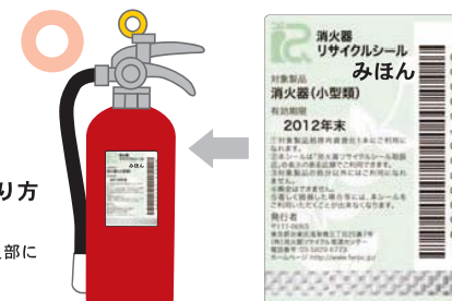
リサイクルシール(見本)