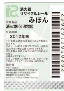
小型用シール (見本)