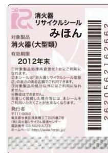
大型用シール (見本)