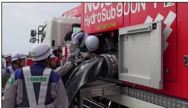
移動式大容量ポンプ車の設置

今後も引き続き報告していくとともに、今回の要請を踏まえ、訓練の評価結果等も新たに鹿児島県に報告していく。