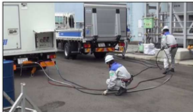
高圧発電機車へのケーブルつなぎ込み