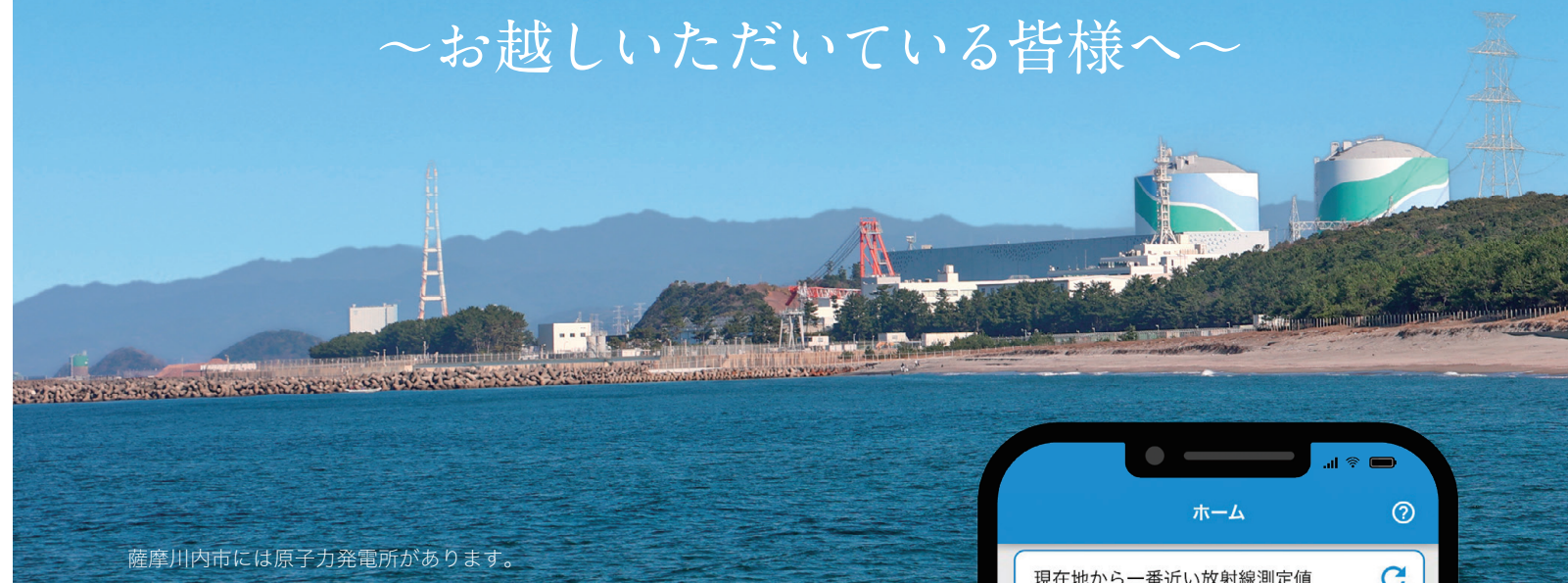
薩摩川内市には原子力発電所があります。