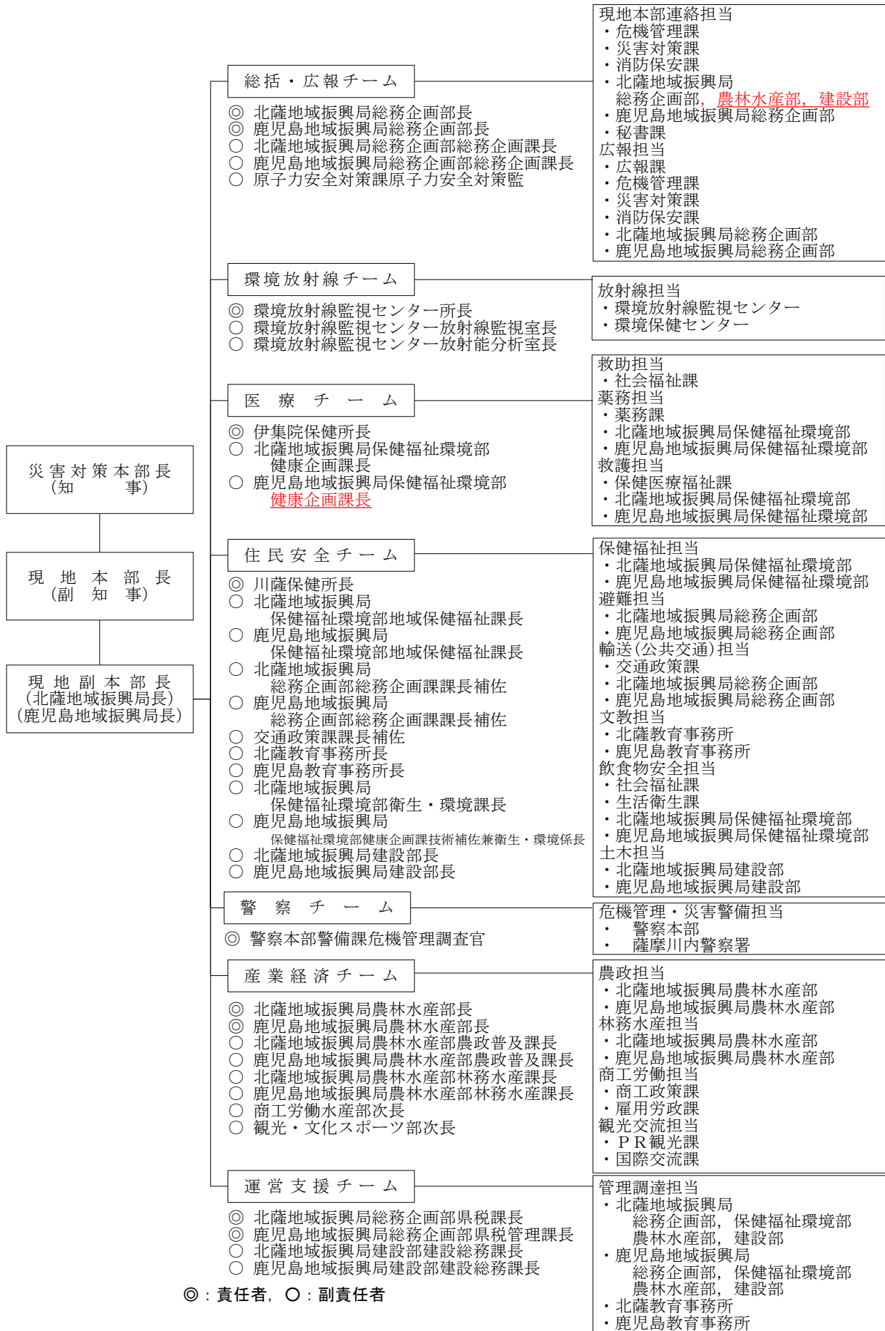
別表7 対策本部体制における現地本部等の組織図