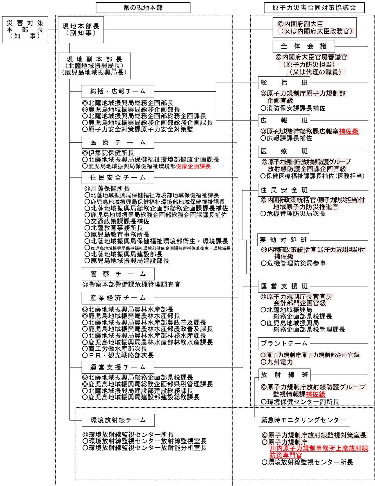
別表9 緊急時体制における現地本部等の組織図