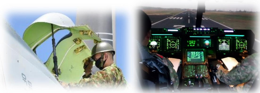
安全対策措置の様子（イメージ）

日々の飛行の際に事前に作成する運用計画についても、「特定の部品の不具合」による事故を防ぐための手順を整理し、この計画に反映させます。