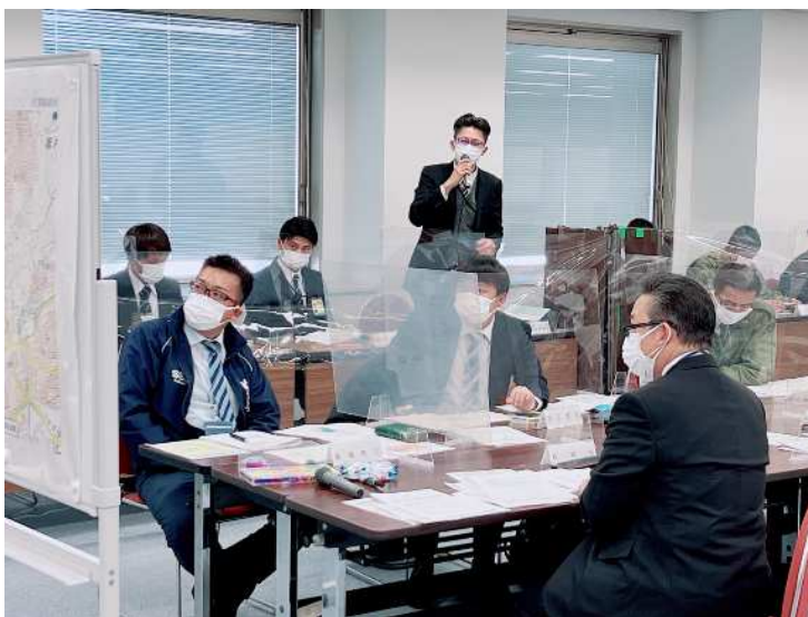
アドバイザーからの発言状況