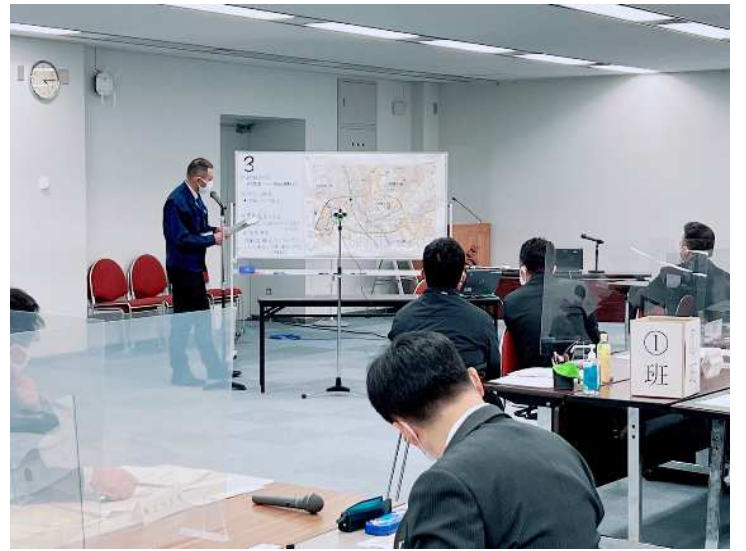
課題検討結果発表状況