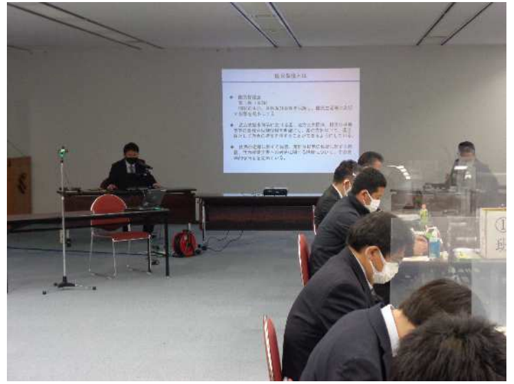
知識講習時の状況