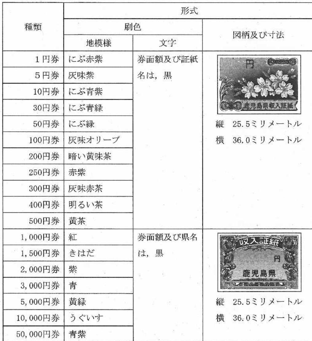
別表第2 (第3条の2関係)