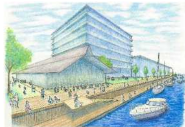
(住吉町 MICE・市場等整備イメージ)