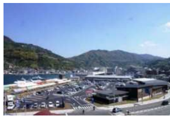
(八幡浜みなと:愛媛県八幡浜市)