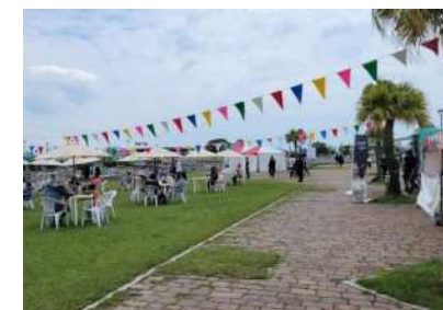
(2024.5.3~5 WF カフェ)