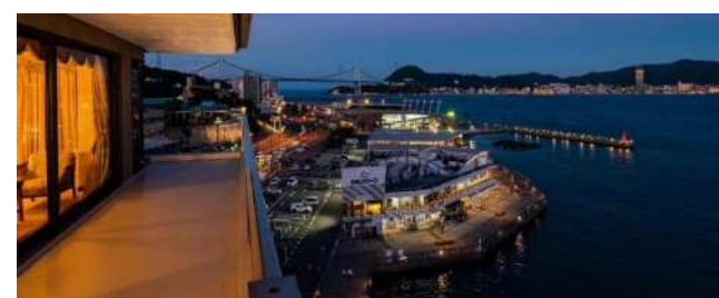
(下関グランドホテルとカモンワーク:下関市)