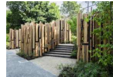
(鍋島松濤公園トイレ)