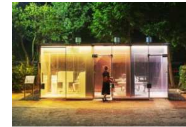
(代々木深町小公園トイレ)