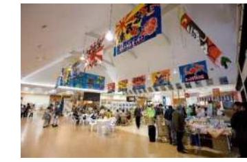
(新湊きつとくと市場:富山県射水市)