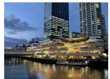
(横浜ベイクォーター:横浜市)