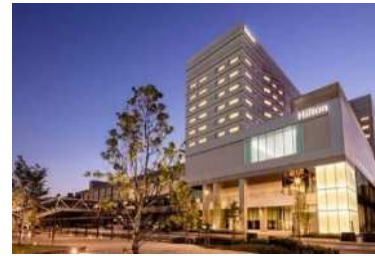
(出島メッセ長崎、ヒルトン長崎:長崎市)