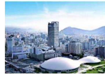
(サンポート高松:香川県高松市)