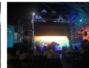
(北ふ頭4号上屋 音楽イベント)