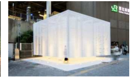
(恵比寿駅西口公衆トイレ)