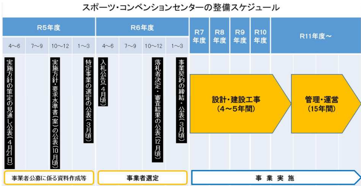
スポーツ・コンベンションセンターの整備スケジュール

選定事業者が本事業を遂行する目的で設立する特別目的会社(SPC)と県との間の事業契約の締結に向けて, 県及び選定事業者の双方の義務(SPCの設立, 事業契約, 秘密保持等)について定めることを目的とする。