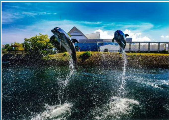
青空イルカウォッチング