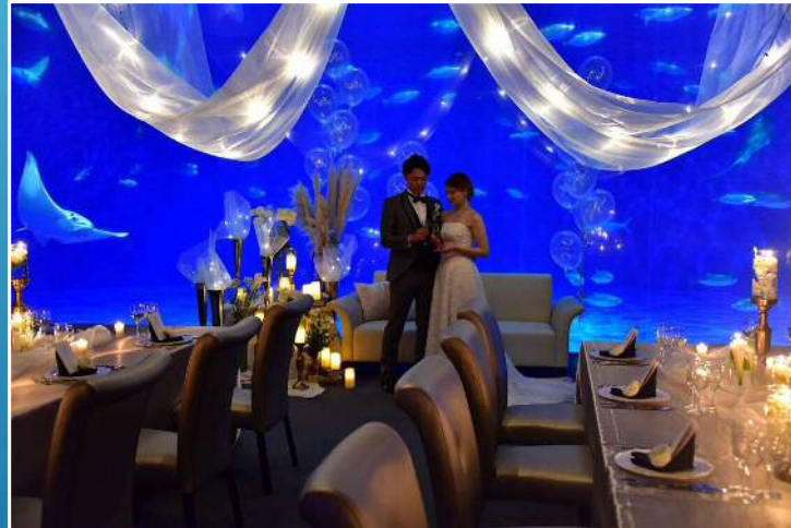
水族館ウェディング(貸切水族館)