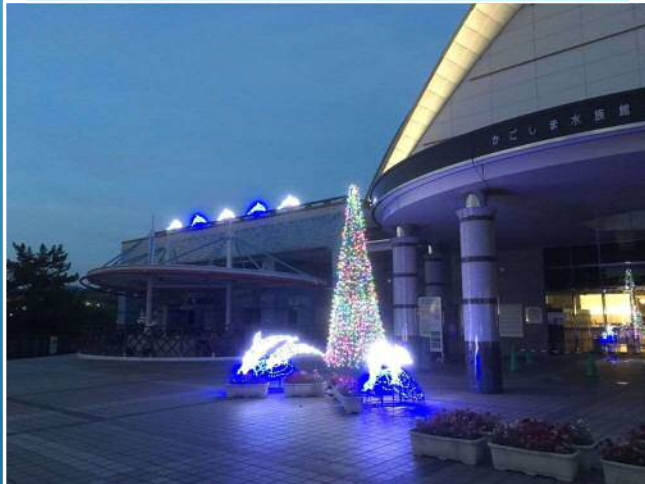
イルミネーションやライトアップ