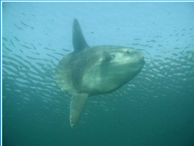
マンボウ(季節展示)