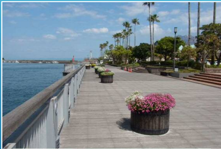
キッチンカーなどの 駐車スペースの整備