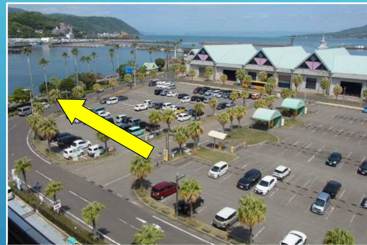
県営第一駐車場からの 歩行アクセスの改良