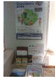
フェリーターミナル