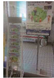
高速船ターミナル