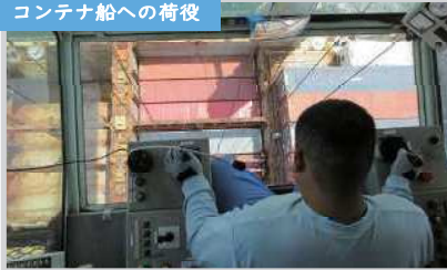
コンテナ船への荷役