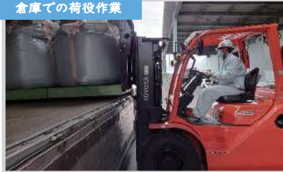
倉庫での荷役作業