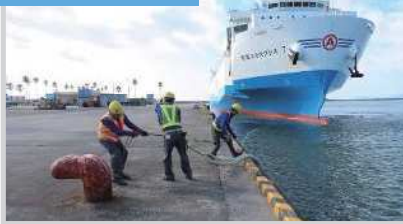
船舶係留時の綱取り