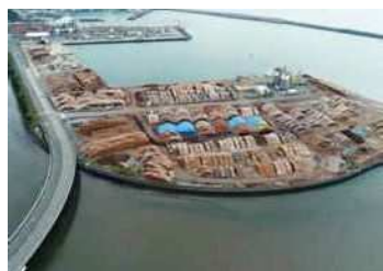
外港地区(第二突堤)

主に中国向けの原木輸出を行っています。Mainly exported to China.