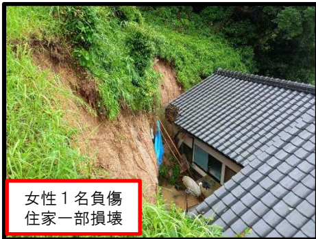
女性1名負傷 住家一部損壊

【被害状況・家屋被害】 住家全壊 0戸 住家半壊 0戸 住家一部損壊 7戸 非住家損壊 6戸