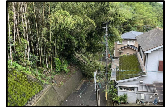
鹿児島市冷水町 7/4 がけ崩れ