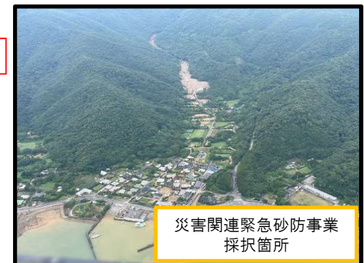
災害関連緊急砂防事業 採択箇所