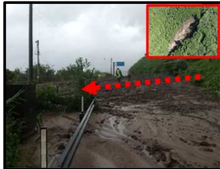
垂水市牛根境 9/18 土石流