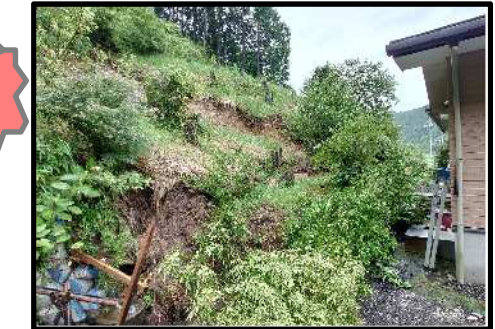
始良市加治木町小山田 7/9 がけ崩れ