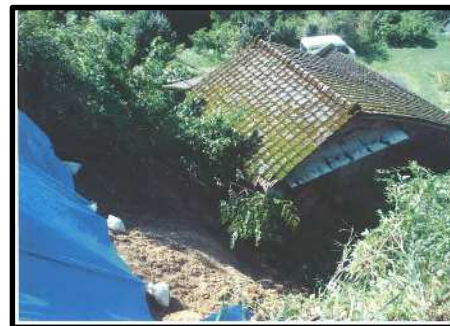
霧島市国分川原 9/18 がけ崩れ