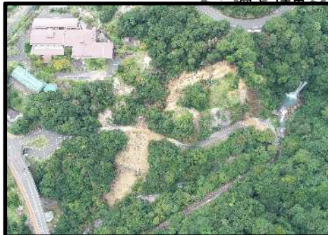
霧島市牧園町 9/18 地すべり