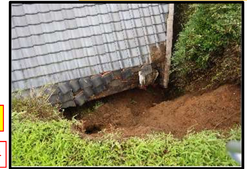
阿久根市脇本 6/5 がけ崩れ