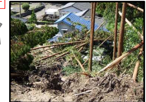
霧島市国分郡田 9/18 がけ崩れ