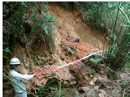
土石流(奄美市浦上川支溪3) 9月25日発生