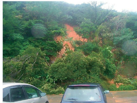
がけ崩れ(龍郷町浦2地区) 9月25日発生