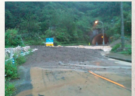
土石流(奄美市脇之戸川) 11月2日発生