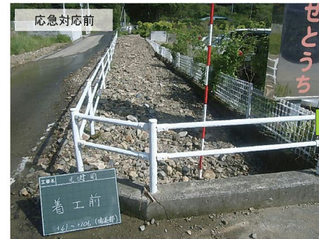
尻田川(瀬戸内町阿木名地内)