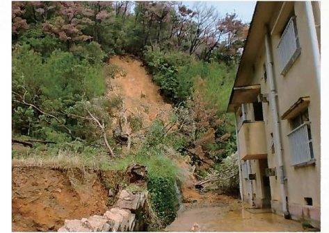
がけ崩れ(瀬戸内町古仁屋7地区) 11月2日発生