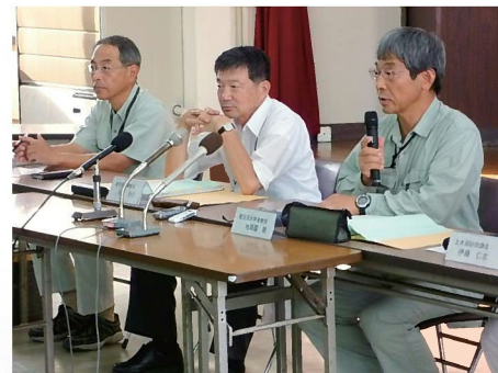
記者会見(於:大島支庁)