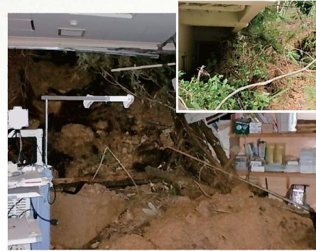
がけ崩れ(瀬戸内町古仁屋19地区) 11月2日発生 診療所一部破損