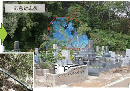
ブルーシート設置