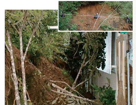
がけ崩れ(瀬戸内町古仁屋13地区) 11月2日発生 住家一部破損 1戸