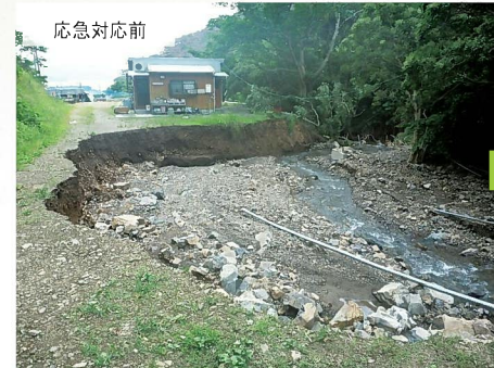
瀬久井小川(瀬戸内町古仁屋地内)