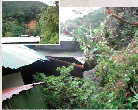
地すべり(龍郷町浦地区) 9月25日発生 住家半壊 1戸