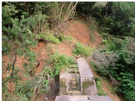
山腹崩壊(龍郷町中里川) 9月27日発生