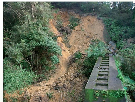
山腹崩壊(瀬戸内町須手沢) 11月2日発生