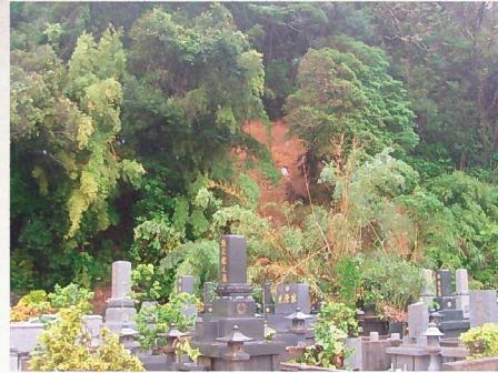
地すべり(龍郷町浦地区) 9月25日発生