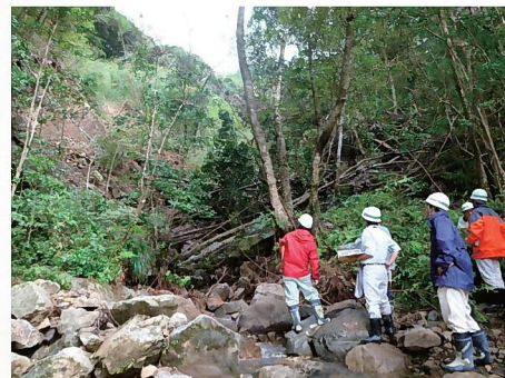
浦上川支溪7の現地調査