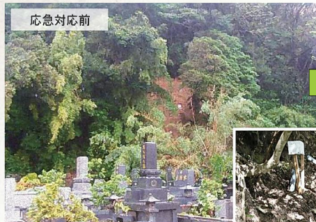
浦地区(龍郷町浦地内)