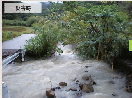
中島川(奄美市名瀬浦上地内)