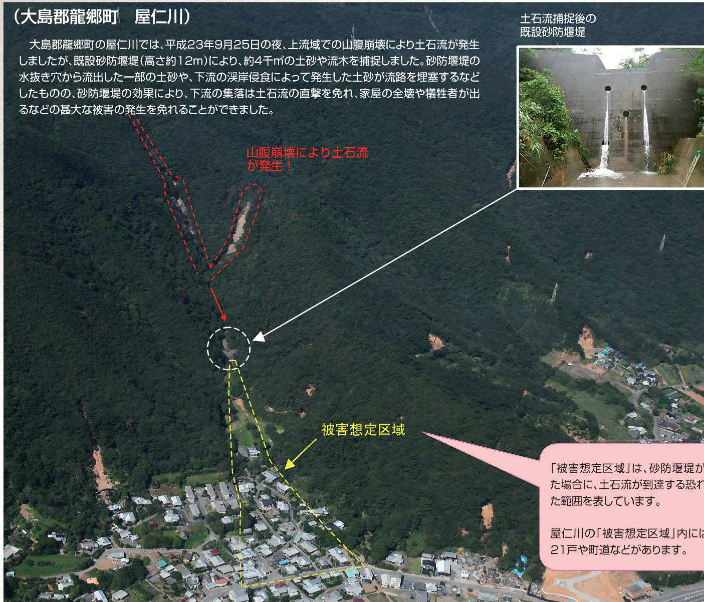
土石流捕捉後の既設砂防堰堤

大島郡龍郷町の屋仁川では、平成23年9月25日の夜、上流域での山腹崩壊により土石流が発生しましたが、既設砂防堰堤(高さ約12m)により、約4千m 3 の土砂や流木を捕捉しました。砂防堰堤の水抜き穴から流出した一部の土砂や、下流の溪岸侵食によって発生した土砂が流路を埋塞するなどしたものの、砂防堰堤の効果により、下流の集落は土石流の直撃を免れ、家屋の全壊や犠牲者が出るなどの甚大な被害の発生を免れることができました。