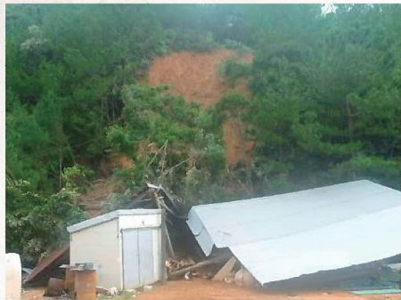
がけ崩れ(龍郷町中勝4地区) 9月25日発生 非住家全壊 1戸