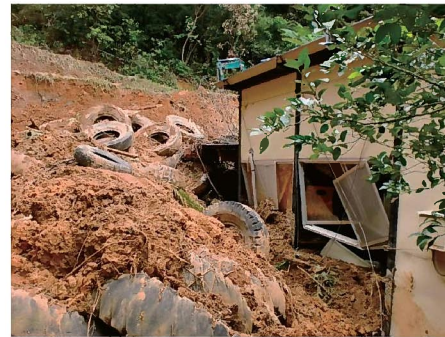
がけ崩れ(瀬戸内町厚瀬地区) 11月2日発生 非住家一部破損 1戸