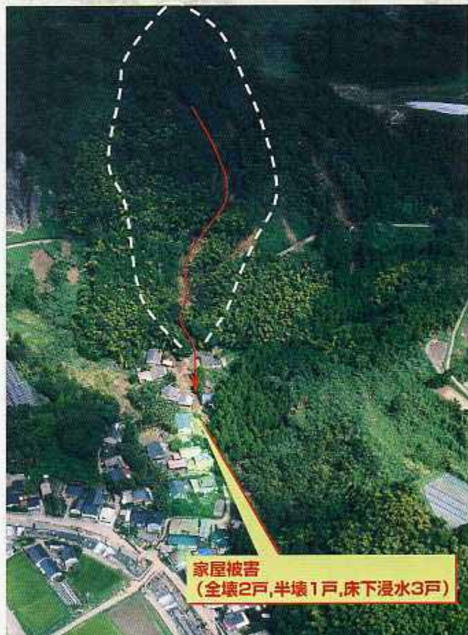
垂水市 上市木地区 【上市木第3小川】