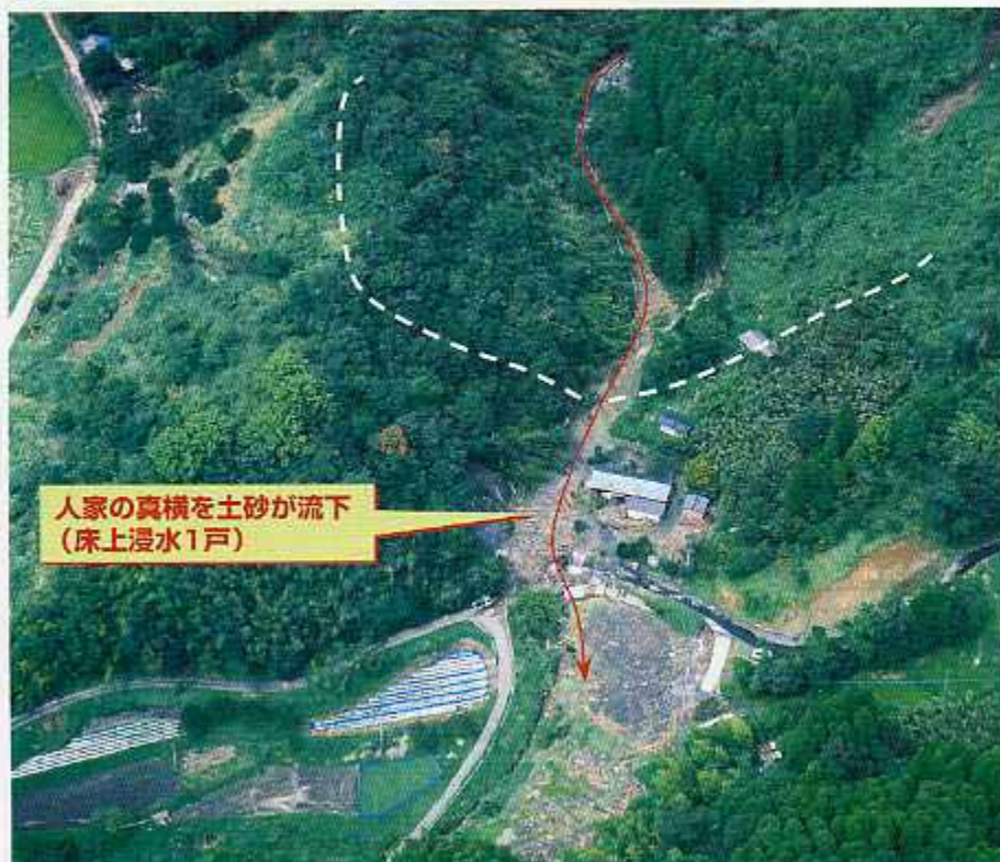
垂水市 田上地区 【田上第3小川】