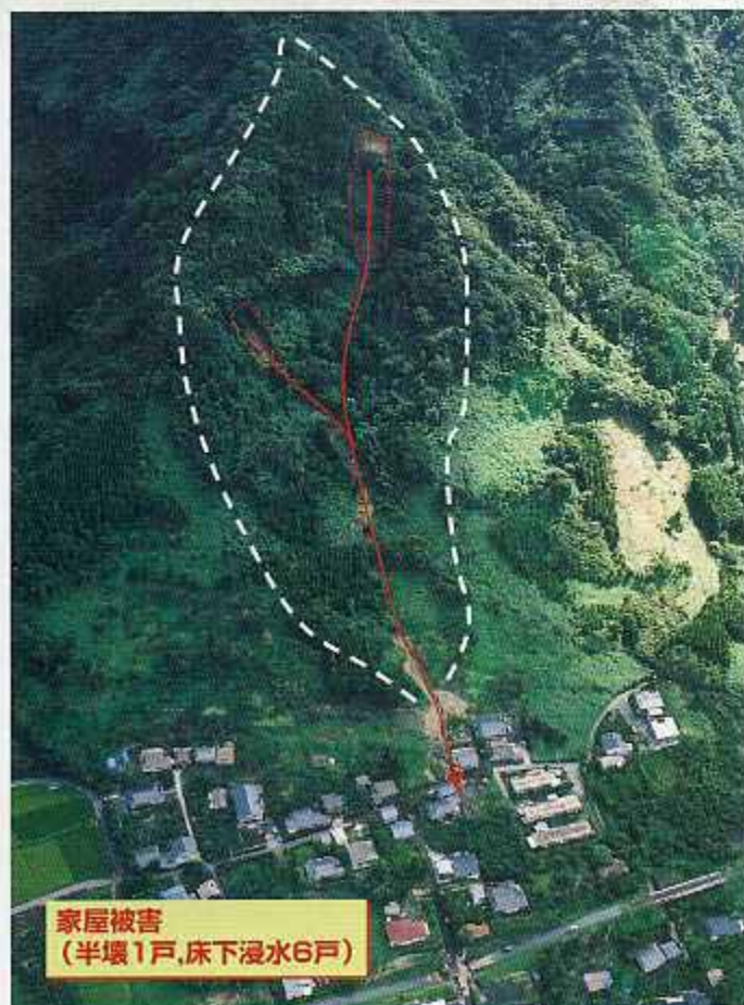
垂水市 牛根麓地区 【麓の小川】