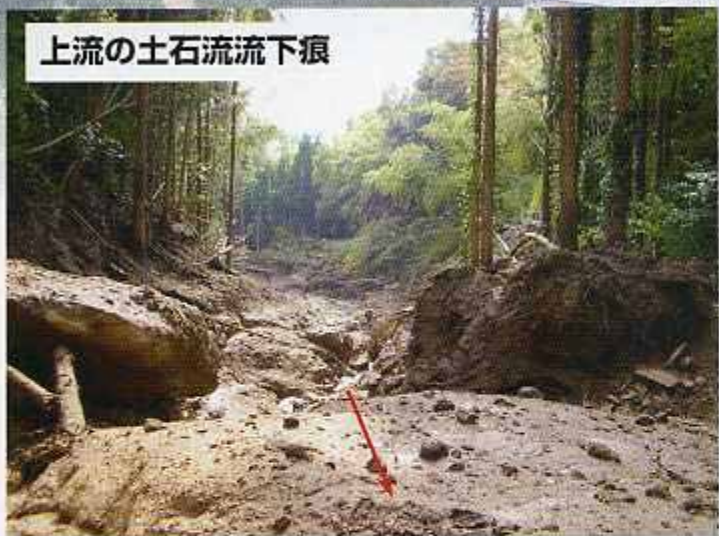
上流の土石流流下痕