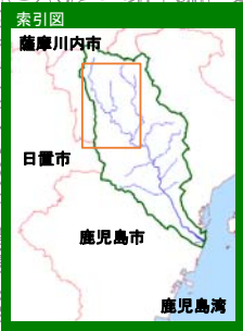
甲突川水系甲突川 【家屋倒壊等氾濫想定区域(氾濫流)】

1 説明文 (1) この図は、甲突川水系甲突川の水位周知区間について、家屋倒壊等をもたらすような氾濫の発生が想定される区域(家屋倒壊等氾濫想定区域)を表示した図面です。 (2) この家屋倒壊等氾濫想定区域は、公表時点の甲突川の河道の整備状況を勘案して、想定し得る最大規模の降雨に伴う洪水により甲突川が氾濫した場合の氾濫流の状況をシミュレーションにより予測したものです。 (3) なお、このシミュレーションの実施にあたっては、支川の決壊による氾濫、シミュレーションの前提となる降雨を超える規模の降雨による氾濫、高潮及び内水による氾濫等を考慮していませんので、この家屋倒壊等氾濫想定区域に指定されていない区域においても家屋倒壊・流出等が発生する場合があります。 (4) また、家屋倒壊等氾濫想定区域は、一定の仮定を与えて算定しており、(3)の条件に加え、倒壊等する家屋は直接基礎の標準的な木造家屋を想定していること、堤防の宅地側には家屋がない更地の状態で氾濫計算をしていることから、この区域の境界は厳密ではなく、家屋の倒壊・流出等の危険性がある区域の目安を示すものとなっています。 2 基本事項等 (1) 作成主体 鹿児島県 (2) 公表年月日 平成30年2月13日 (3) 対象となる水位周知河川 ・甲突川水系甲突川(実施区間) 左右岸 鹿児島市郡山町3494番地先の伊良ヶ谷滝から海に至る (4) 算出の前提となる降雨 甲突川流域の12時間の総雨量822mm (5) 関係市町村 鹿児島市