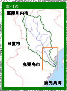
甲突川水系甲突川 【家屋倒壊等氾濫想定区域(氾濫流)】

1 説明文 (1) この図は、甲突川水系甲突川の水位周知区間について、家屋倒壊等をもたらすような氾濫の発生が想定される区域(家屋倒壊等氾濫想定区域)を表示した図面です。 (2) この家屋倒壊等氾濫想定区域は、公表時点の甲突川の河道の整備状況を勘案して、想定し得る最大規模の降雨に伴う洪水により甲突川が氾濫した場合の氾濫流の状況をシミュレーションにより予測したものです。 (3) なお、このシミュレーションの実施にあたっては、支川の決壊による氾濫、シミュレーションの前提となる降雨を超える規模の降雨による氾濫、高潮及び内水による氾濫等を考慮していませんので、この家屋倒壊等氾濫想定区域に指定されていない区域においても家屋倒壊・流出等が発生する場合があります。 (4) また、家屋倒壊等氾濫想定区域は、一定の仮定を与えて算定しており、(3)の条件に加え、倒壊等する家屋は直接基礎の標準的な木造家屋を想定していること、堤防の宅地側には家屋がない更地の状態で氾濫計算をしていることから、この区域の境界は厳密ではなく、家屋の倒壊・流出等の危険性がある区域の目安を示すものとなっています。 2 基本事項等 (1) 作成主体 鹿児島県 (2) 公表年月日 平成30年2月13日 (3) 対象となる水位周知河川 ・ 甲突川水系甲突川(実施区間) 左右岸 鹿児島市郡山町3494番地先の伊良ヶ谷滝から海に至る (4) 算出の前提となる降雨 甲突川流域の12時間の総雨量82mm (5) 関係市町村 鹿児島市