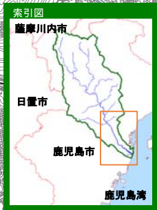
甲突川水系甲突川 【計画規模】

1 説明文 (1) この図は、甲突川水系甲突川の水位周知区間について、水防法の規定に基づき計画降雨により浸水が想定される区域、浸水した場合に想定される水深を表示した図面です。 (2) この洪水浸水想定区域図は、公表時点の甲突川の河道の整備状況を勘案して、洪水防御に関する計画の基本となる年超過確率1/100（毎年、1年間にその規模を超える洪水が発生する確率が1/100（約1%））の降雨に伴う洪水により甲突川が氾濫した場合の浸水の状況をシミュレーションにより予測したものです。 (3) なお、このシミュレーションの実施にあたっては、支川の決壊による氾濫、シミュレーションの前提となる降雨を超える規模の降雨による氾濫、高潮及び内水による氾濫等を考慮していませんので、この浸水が想定される区域以外の区域においても浸水が発生する場合や、想定される水深が実際の浸水深と異なる場合があります。 2 基本事項等 (1) 作成主体 鹿児島県 (2) 公表年月日 平成30年2月13日 (3) 告示番号 鹿児島県告示第133号 (4) 根拠法令 水防法（昭和24年法律第193号）第14条第2項 (5) 対象となる水位周知河川 ・ 甲突川水系甲突川（実施区間） 左右岸 鹿児島市郡山町3494番地先の伊良ヶ谷滝から海に至る (6) 算出の前提となる降雨 甲突川流域の日雨量390mm、時間雨量110mm (7) 関係市町村 鹿児島市