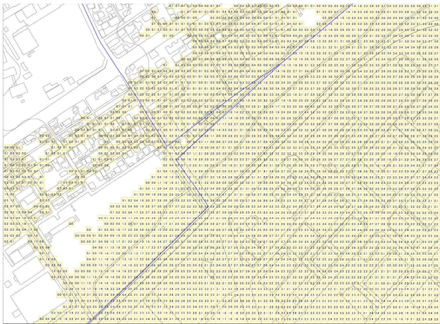
様式-2 津波災害警戒区域 区域図