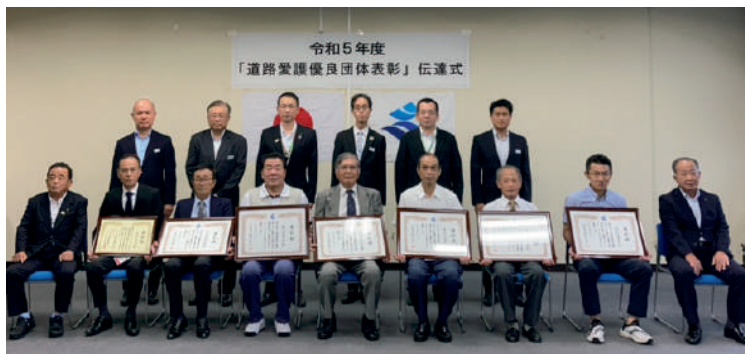
（知事表彰及び功労者表彰）南薩地域振興局管内の7団体