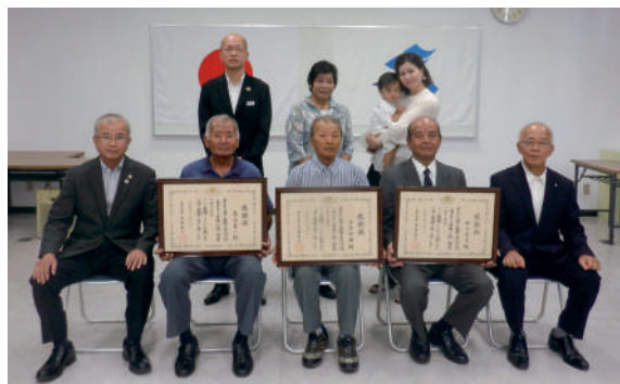
（大臣表彰）徳之島の3個人