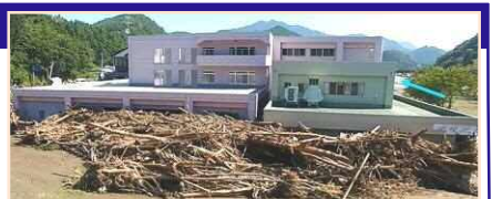
平成28年台風10号により、岩手県の要配慮者利用施設では利用者9名の全員が死亡。