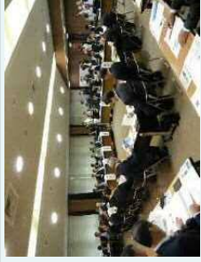
協議会の開催状況