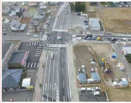
整備前 写真 (H24)