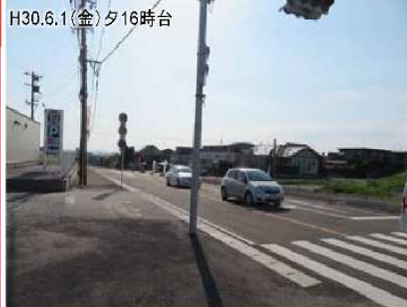
写真②下田町から帯迫中央交差点を臨む(県209号)