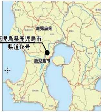
整備前 写真 (H18)