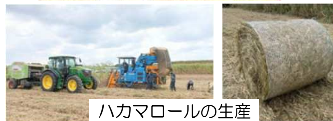
ハカマロールの生産