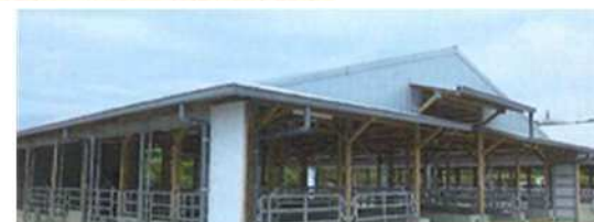
家畜飼養管理施設の整備 イメージ