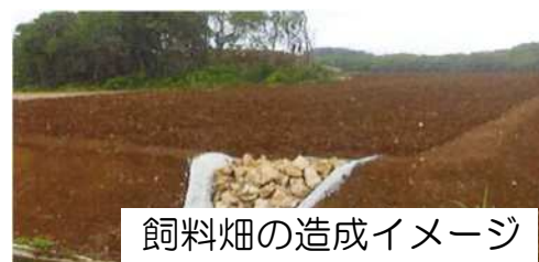
飼料畑の造成イメージ

●飼料生産基盤の強化による地域の中核となる畜産経営体の育成を通じた畜産主産地の形成を目指します。