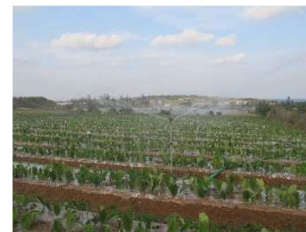
散水状況（さといも）