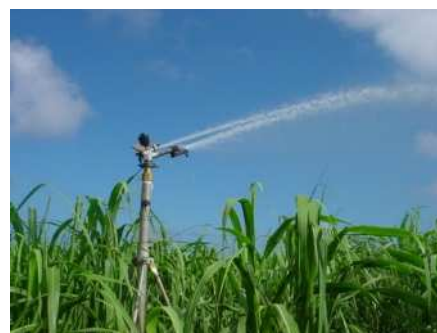
散水状況（サトウキビ）

□ 畑地かんがい末端散水施設を整備することで、生産性及び作物品質の向上、高付加価値作物の生産拡大を図ります。