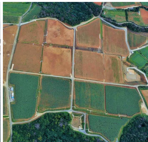
■「農林水産業の「稼ぐ力」の向上に資する生産基盤づくり」 を図る事業 農地等の整備（写真：徳之島町第二南亀地区）