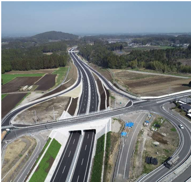
■人やモノの交流を支える陸海空の交通ネットワークの形成 地域高規格道路の整備（写真：都城志布志道路 末吉道路）