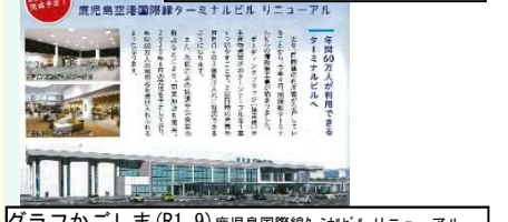
グラフかごしま(R1.9)鹿児島国際ターミナルビルリニューアル