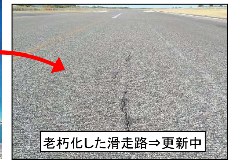
老朽化した滑走路→更新中