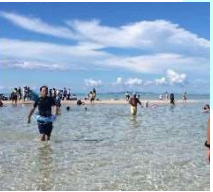
百合ヶ浜(与論島) 至 沖繩(那覇)