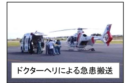
ドクターヘリによる急患搬送