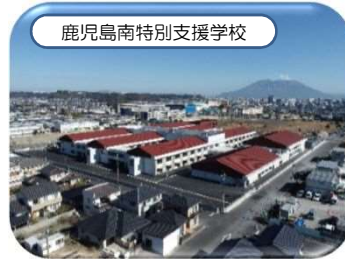
鹿児島南特別支援学校