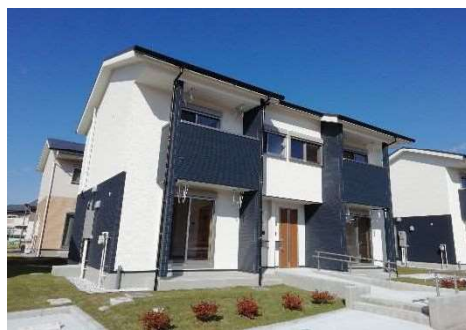
緑地と緑地を取り囲む住棟(左:1期, 右:7-2期)