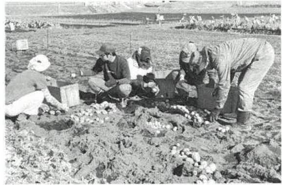
バレイシヨの収穫