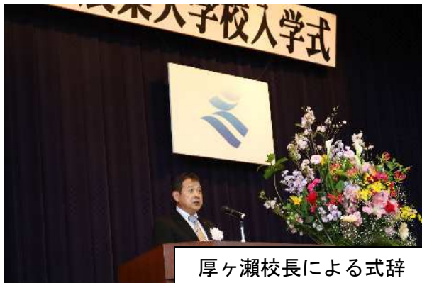
厚ヶ瀬校長による式辞