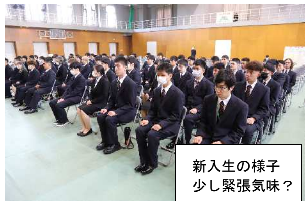
新入生の様子 少し緊張気味？