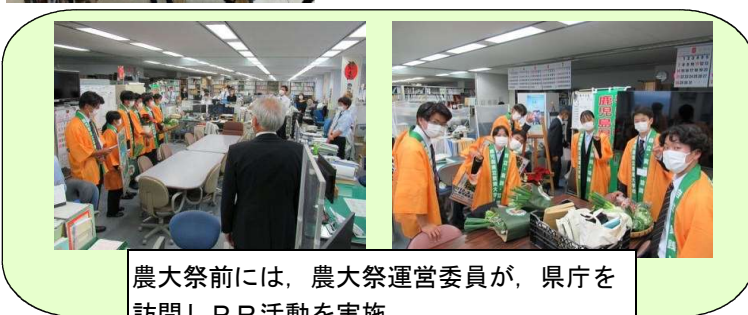
農大祭前には、農大祭運営委員が、県庁を訪問しPR活動を実施