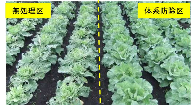
キャベツほ場でのコナガによる被害状況