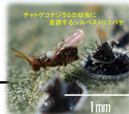
チャトゲコナジラミの幼虫に産卵するシルベストリコバチ