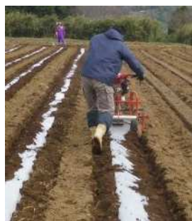
種子島のマルチ被覆作業の様子(株だし栽培)